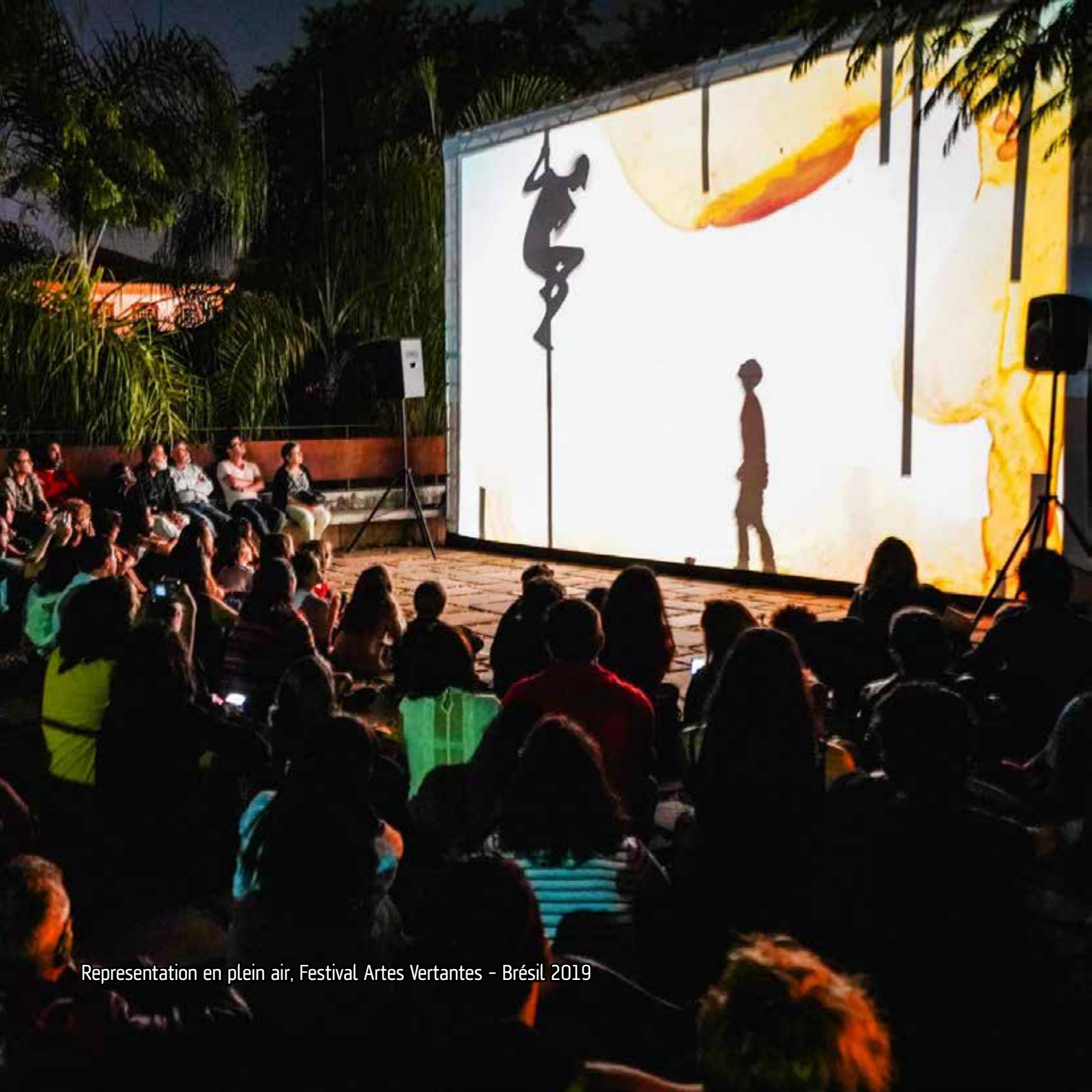
Representation en plein air, Festival Artes Vertantes - Brésil 2019